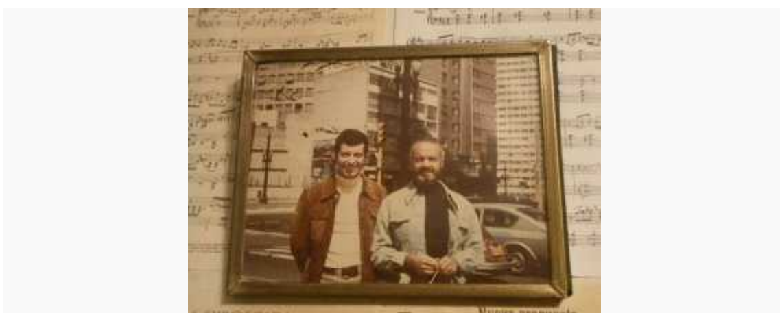
Saul Cosentino e Astor Piazzolla

Un viaggio speciale e raffinato che il pubblico ha accolto calorosamente, tributando il giusto applauso all'Alamprese, voce della cultura argentina contemporanea, e ai bravissimi musicisti in scena.